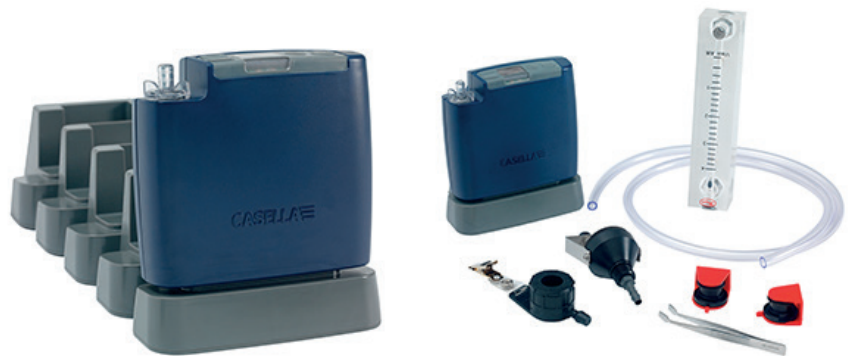
Docking station voor 5 Apex2