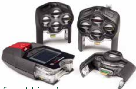
Volledig modulaire opbouw

De Blackline Safety G7c is gasdetector en man-down-toestel in één. Hij waarschuwt op afstand, automatisch, hulpverleners bij nood via het mobiele 4G-netwerk. Want alarmen redden geen mensen; mensen redden mensen.