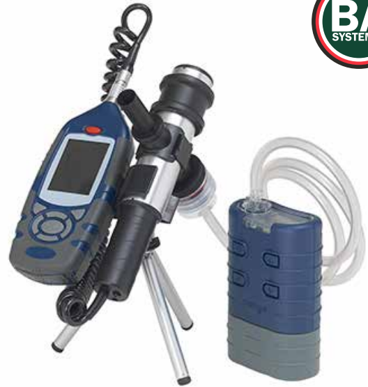
Gravimetrische kalibratie voor specifieke stofsoorten