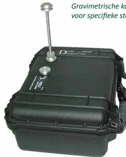
Dust Detective behuizing